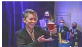
Alvia a "Roma Bar Show" le candidature per Lady Amarena 2023 26 Maggio 2023 In "Focus"