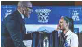
Lady Amarena 2022: sul podio Germania, Spagna e Svizzera 25 Settembre 2022 In "Focus"