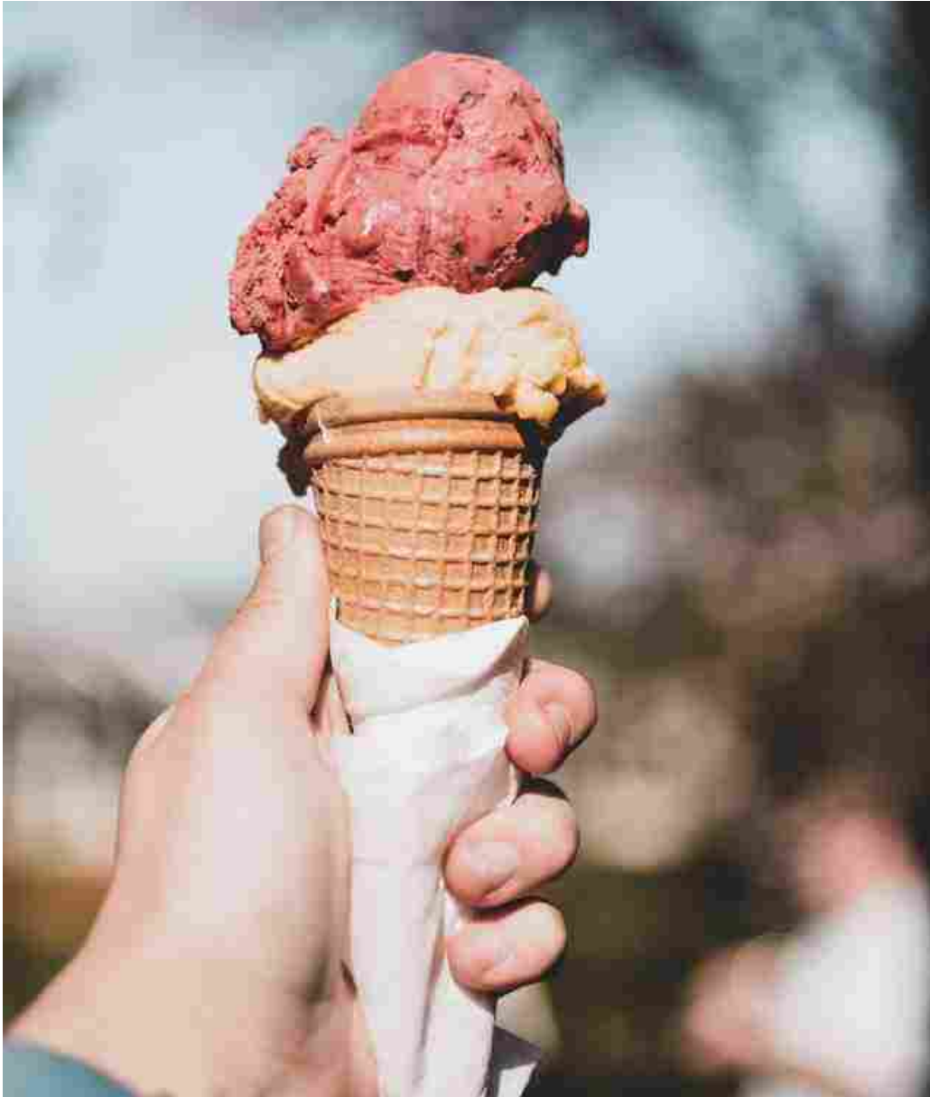
Un cono gelato