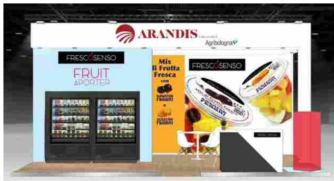
Lo stand AgriBologna a Cibus 2024

La varietà dei colori e dei sapori della frutta di Fresco Senso s'incontra e si "esalta" con Amarena Fabbri e Zenzero Fabbri . Il formato è da 180 g, con film pelabile e uno stecchino di bambù, pronto per il consumo. L'innovativa combinazione della frutta fresca di Fresco Senso, arricchita con l'Amarena Fabbri e lo Zenzero Fabbri è concepita per soddisfare gli amanti della frutta pronta da gustare. La praticità, la salubrità e tutta la freschezza naturale, propri dei mix Fresco Senso, si uniscono a una "nota" di ulteriore dolcezza e piacere, a marchio Fabbri 1905. Un piacevole momento di gusto che combina la miglior frutta fresca alla frutta semi candita, ricca di storia e tradizioni decennali. I mix presentati a CIBUS vanno a integrare la proposta di oltre 70 referenze Fresco Senso, pronte a incontrare le più diverse esigenze stagionali, di stili di vita, di gusto e di praticità.